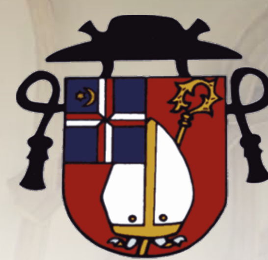
Římskokatolická farnost děkanství Loune

Každý den kolem nich chodíme – kaple, kříže, kostely, Boží muka. Často je už ani nevnímáme. Přesto jsou to místa, která naši předkové vybrali a zasvětili Bohu. Římskokatolická farnost – děkanství Loune a město Loune společně připravily šestnáct zastavení na těchto místech, kde sakrální stavba stojí, stála či měla stát, a zvou Vás takto k malé procházce po místech, která někdy i jen bezmyšlenkovitě míváme.